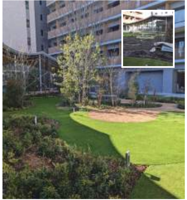
belgravia38mm(他3種) ・ 冷却効果セーフシエル