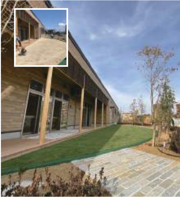
mayfair30mm ・ 冷却効果セーフシエル