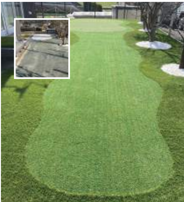
Easiput16mm ・ 抗菌エンバイオフィル