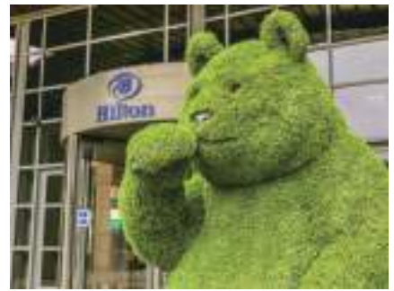
ヒルトンホテルでのイベント開催