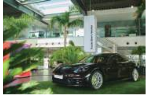
ポルシェとのタイアップ

最新技術で生み出された天然芝のようなさわり心地が高く評価され、ナイキ・アディダス・ヤフーやノキアなどの企業イベントでも利用されています。